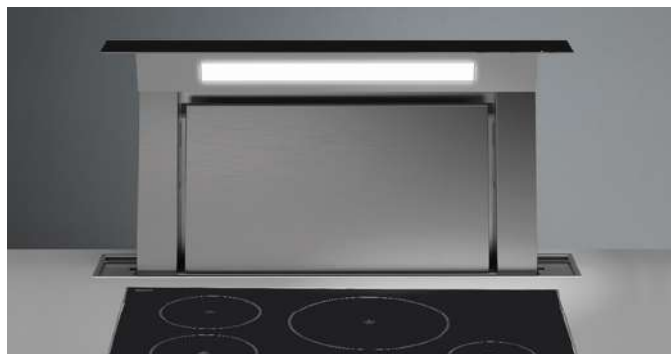
Das Bild dient rein einer groben Information. Es kann von der ausgewählten Version abweichen.